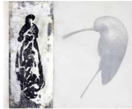
-fülle-, Mischtechnik, Fotografie unter Wachs © Ulrike von Quast / VG Bild-Kunst

Andere Arbeiten in der Ausstellung thematisieren das Verhältnis zwischen Mensch und Natur. Vergänglichkeit, aber auch Selbsterhalt und regenerative Kräfte der Natur rücken zunehmend in den Fokus - und damit auch ihre Gefährdung.