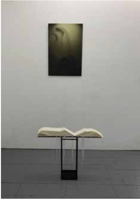
Buch der Zeit © Martina Justus