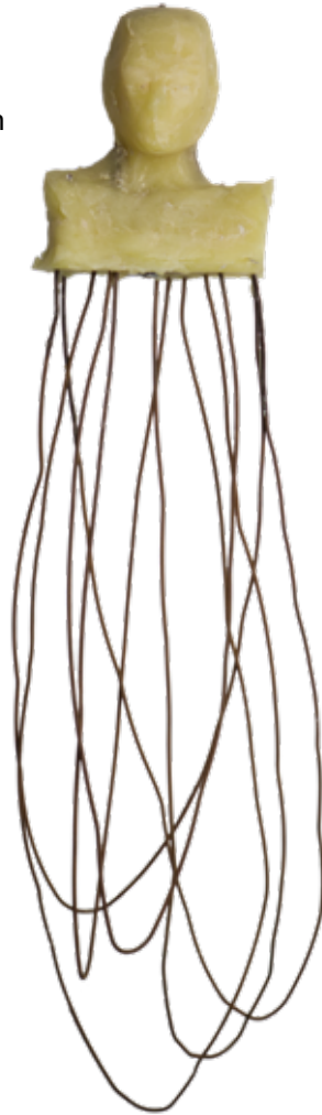
-flüchtig-, Wachs, Draht © Ulrike von Quast / VG Bild-Kunst

Wie können wir uns darin verorten und sind doch konfrontiert mit ihrer Eigengesetzlichkeit und Vielschichtigkeit?