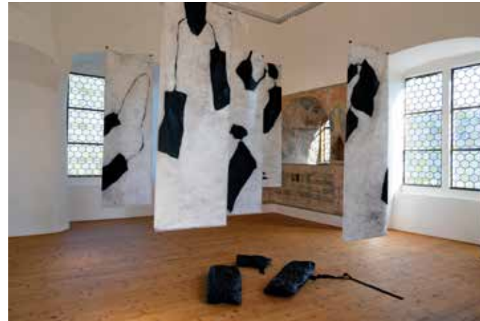
-gestrandet-, Fahnen: Öl und Wachs auf Wenzouh-Chinapapier | Objekt: Papier, Stoff © Isa Steinhäuser

Andere Arbeiten in der Ausstellung thematisieren das Verhältnis zwischen Mensch und Natur. Vergänglichkeit, aber auch Selbsterhalt und regenerative Kräfte der Natur rücken zunehmend in den Fokus - und damit auch ihre Gefährdung.